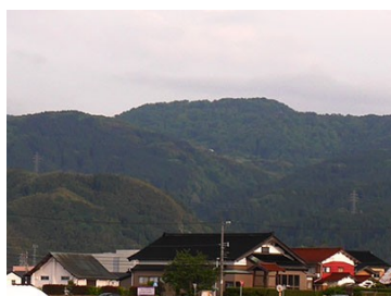
平野部から見ると馬の鞍のように見える倉ヶ岳

「故墟考」は七国志を引用し、天正8年（1580）佐久間盛政が放火した城郭の中に、倉ヶ岳城があったことを伝える。