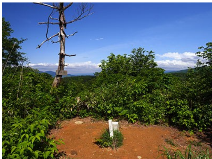
倉ヶ岳の山頂三角点のある主郭