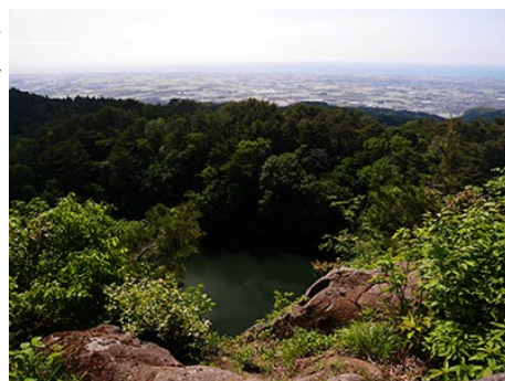
のぞきから大池や加賀平野を望む