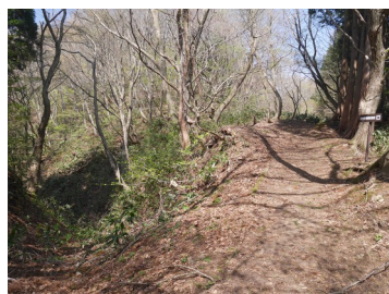
多根道と遊歩道大御前道