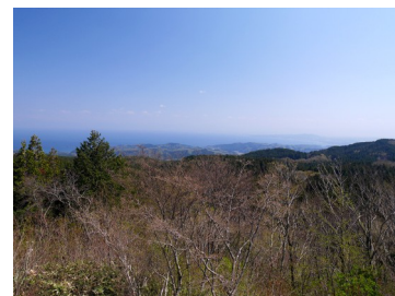
展望台から富山湾方向