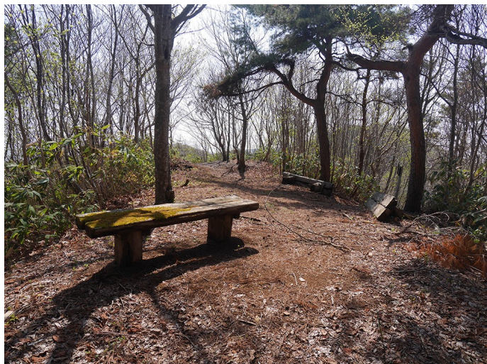
主郭は石動山パノラマ展望台になっている