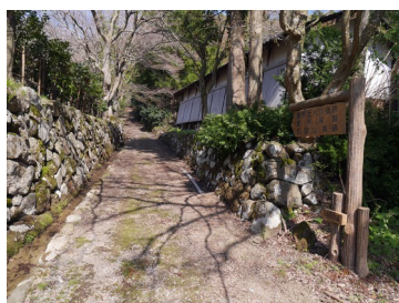
石動山資料館前の石動山城跡に向かう道を直進する

石動山七口のひとつ、多根道を見下ろす丘陵上に占地する。多根道を挟んで石動山城とは300mの至近距離にあり、石動山城の出城として多根道を監視したとも考えられている。