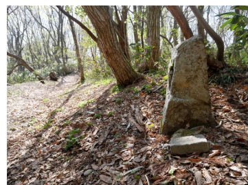
多根口の庚申供養塔

いしかわ城郭カードに関する最新情報・お問い合わせ 北陸城郭プロジェクト（フリー・スタイル有限公司） 〒929-0335 石川県河北郡津幡町井上の荘3-9 TEL. 076-204-6046 FAX. 076-289-3943 E-MAIL. contact@j-sampo.com ホームページ城郭さんぽ https://www.j-sampo.com/