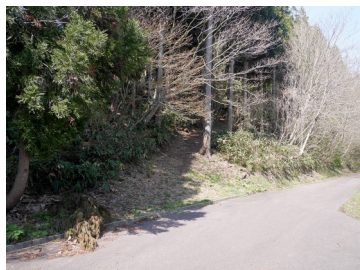
林道亀石線を横切り展望台へ 林道終点に駐車場有り