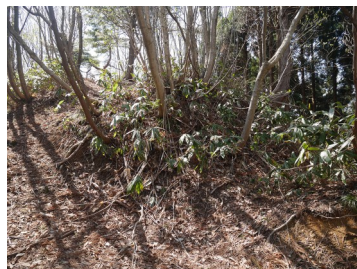
主郭東方直下の堀切