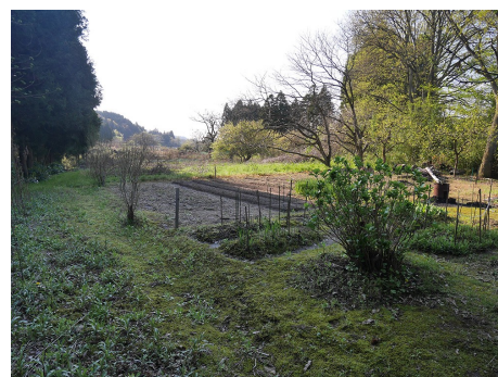
主郭は畑地となっている