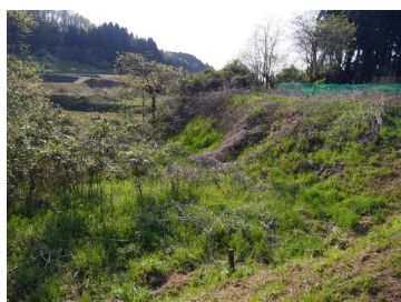
上から見た内柵形虎口

残る城郭遺構が不明瞭な中、内柵形虎口は注目される。入口が切岸と土塁に挟まれた高度な造りで唯一残る明確な城郭施設といえる。