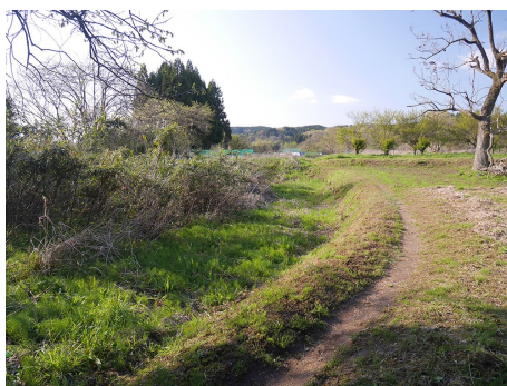
内柵形虎口に沿う土塁の先に南北を仕切る土塁状高まりが残る