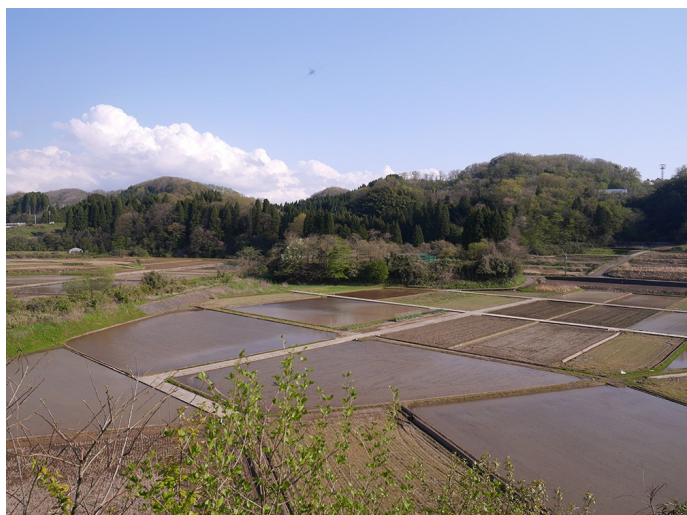
梨木城から見た上野館

所在地：石川県金沢市薬師町 立地：丘陵先端、標高26m 城主：上野氏 時期：戦国 見学時間（参考）：約10分