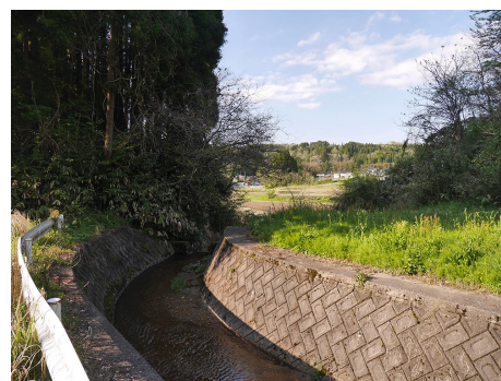
尾根を分断して流れる水路

いしかわ城郭カードに関する最新情報・お問い合わせ 北陸城郭プロジェクト（フリー・スタイル有限会社） 〒929-0335 石川県河北郡津幡町井上の荘3-9 TEL. 076-204-6046 FAX. 076-289-3943 E-MAIL. contact@j-sampo.com ホームページ城郭さんぽ https://www.j-sampo.com/