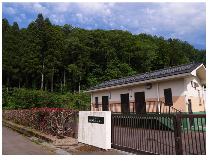
小松市原浄化センター後方の丘陵に占地する