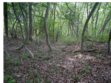
雑木に覆われる主郭