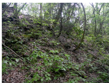
谷間の途中、右手（南）尾根が低くなった所を登る

墨線土塁や柵形虎口など織豊系城郭の特徴が見られ、岩淵城と同時期に築城されたと推定されているが、平坦面に自然地形が多く残るので短期の使用で放棄されたと考えられる。