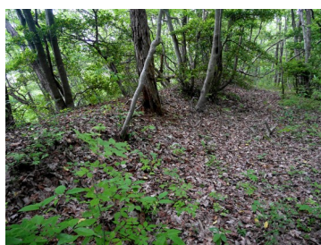
主郭を巡る墨線土塁