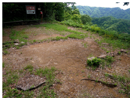
主郭の旧監視所基礎