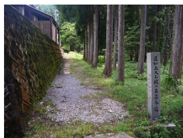
大杉みどりの里城山登山口 （蓮如上人お杖の名泉参道）

北麓に大杉谷街道が通る交通の要衝で、大杉谷川流域城郭群では最奥に位置する。奥城山（515m）に至る尾根続き途中