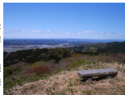
主郭から西方に邑知平野

天正10年（1582）6月、本能寺の変後の混乱を利用して、畠山旧臣の温井氏・三宅氏ら上杉方が能登奪還を図り、石動山衆徒を味方に荒山城や石動山に立て籠もる。能登領主の前田利家は越前の柴田勝家に加勢を要請し、佐久間盛政とともに荒山城を攻撃する。石動山に続く荒山道を主戦場とした荒山合戦で、荒山城は落城、そのままの勢いで石動山全域が焼亡する石動山合戦へと発展する。その後、石動山は前田利家の支配下に入るが、荒山城と勝山城の荒山往来沿いにある両城は能越国境を抑えるために敵対する越中の佐々成政が使用することになった。