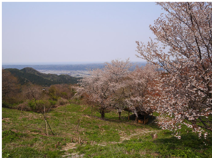
4月下旬には遊歩道沿いに桜が咲く