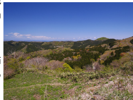
主郭から北東方に石動山

境の末森城を攻めた末森合戦では、前田方が荒山・勝山城を攻めるも落とせず、10月に佐々方が撤退した後は前田氏の支配下に入った。