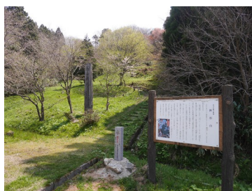
林道城石線沿いに 駐車場と登城口がある

能越国境にある尾根の頂部に位置し、石動山七口のひとつ、荒山道が城内を通る。能登・越中をつなぐ荒山往来が南西の直近を通り、石動山城郭群では荒山峠に最も近い。