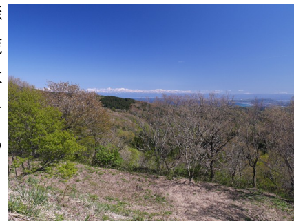
主郭から南東方に富山湾

いしかわ城郭カードに関する最新情報・お問い合わせ 北陸城郭プロジェクト（フリー・スタイル株式会社） 〒929-0335 石川県河北郡津幡町井上の荘3-9 TEL. 076-204-6046 FAX. 076-289-3943 E-MAIL. contact@j-sampo.com ホームページ城郭さんぽ https://www.j-sampo.com/