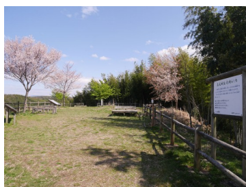
高尾城址見晴らし台 (ジョウヤマ)

所在地：石川県金沢市高尾町 別 称：多胡城、富樫城 立 地：丘陵頂部、標高190m 城 主：富樫政親、一向一揆 時 期：室町、戦国 見学時間（参考）：30分～1時間