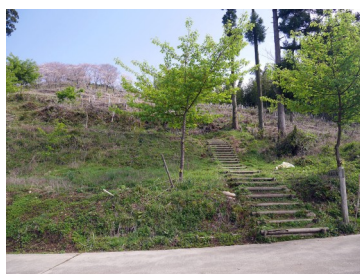
高尾城址見晴らし台入口