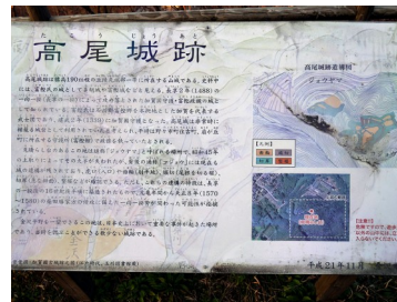
見晴らし台の案内板

いしかわ城郭カードに関する最新情報・お問い合わせ 北陸城郭プロジェクト（フリー・スタイル有限会社） 〒929-0335 石川県河北郡津幡町井上の荘3-9 TEL. 076-204-6046 FAX. 076-289-3943 E-MAIL. contact@j-sampo.com ホームページ城郭さんぽ https://www.j-sampo.com/